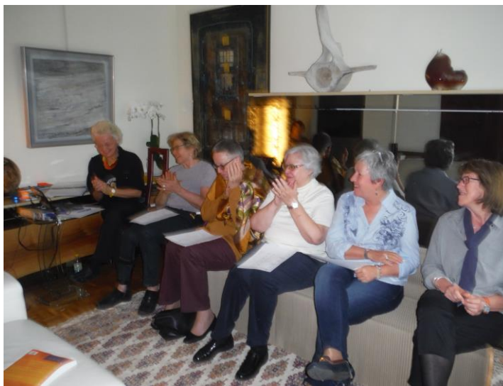
AGO 2015 : quelques participantes